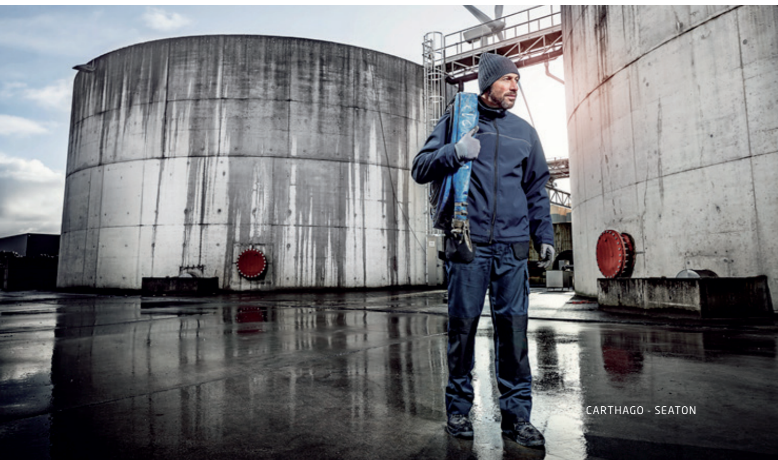
CARTHAGO - SEATON